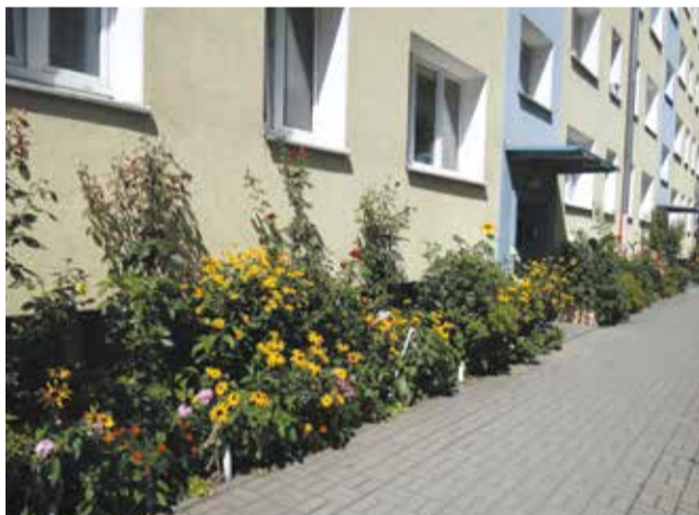
Wyróżnienie Dyrektora Ogrodu Botanicznego UAM za „Zieleń i woda”