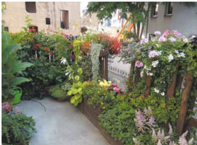
I miejsce w kategorii balkon