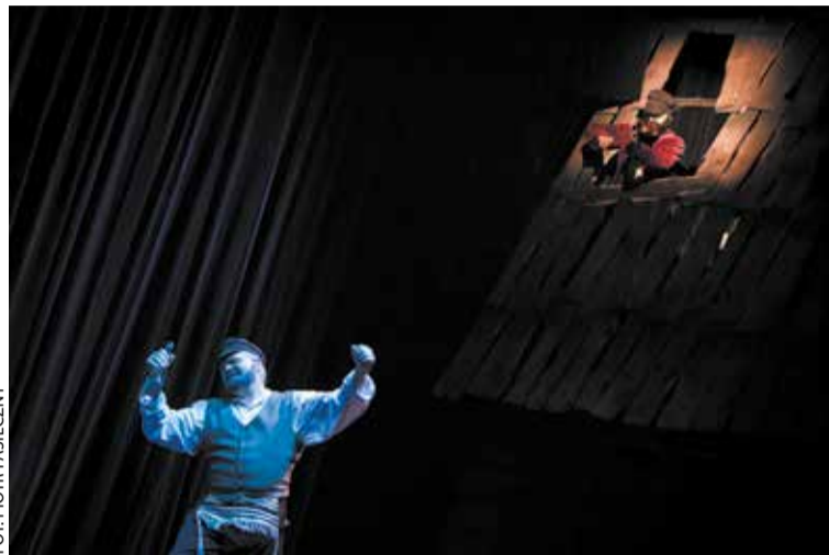
Spektakl Skrzypek na dachu