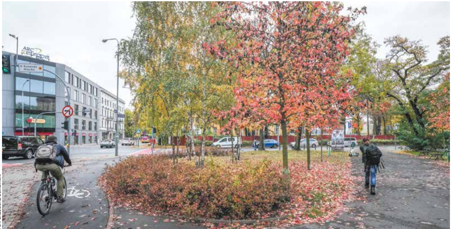
Skwer im. Łukasza Horowskiego

W 2007 roku został konsulem honorowym Ukrainy w Poznaniu. Warto wiedzieć, że jest to funkcja społeczna. Konsul honorowy nie pobiera wynagrodzenia za pracę, ale w miarę swoich możliwości, reprezentuje, pomaga i wspiera mieszkańców kraju, który go na to stanowisko wyznaczył. W krótkim czasie Horowski stał się postacią znaną, osobą-instytucją, niezwykle ważną dla powiększającej się ukraińskiej społeczności naszego miasta. Ważne i niezapomniane są jego działania na polu kultury. Był prze-