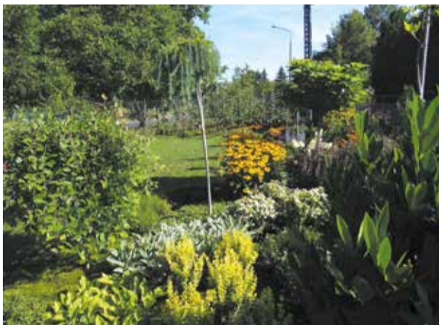
I miejsce w kategorii działki na terenach Rodzinnych Ogrodów Działkowych