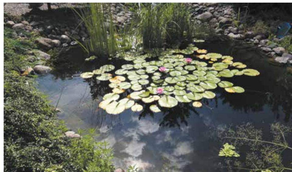
I miejsce w kategorii zieleńce oraz wyróżnienie Kierownika Katedry Roślin Ozdobnych, Dendrologii i Sadownictwa Uniwersytetu Przyrodniczego za zieleńce przydatny hortiterapii biernej i czynnej