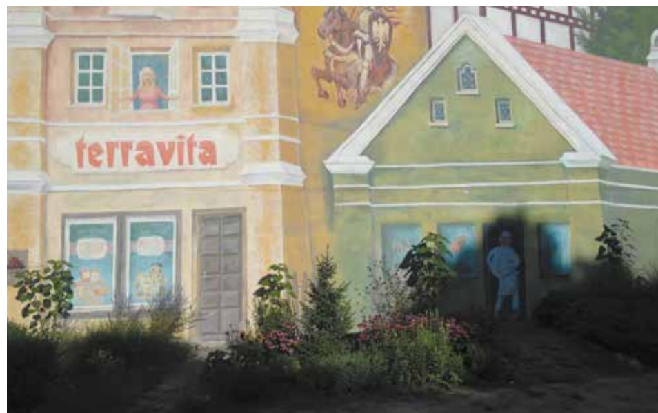
I miejsce w kategorii pasy zieleni