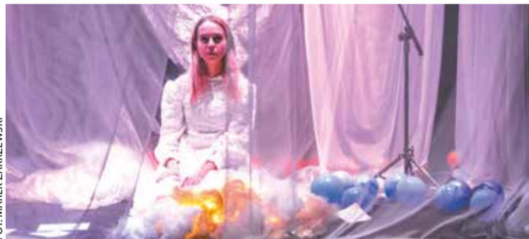
Św. pępek świata, Scena Robocza

Wejściówki można rezerwować pod adresem: biuro@scenarobocza.pl , przed wejściem dostępna będzie pula wejściówek, liczba miejsc jest ograniczona. Harmonogram spektakli: 10–11.12, g. 19 – Dla nas nie zabraknie krzesel (twórcy to artyści, wśród których znajdują się także osoby z niepełnosprawnościami, chcą zwrócić uwagę, że każdy wykluczony ma swój własny głos); 16.12, g. 19 – Św. pępek świata (Każdy albo prawie każdy mężczyzna wie, że po całym