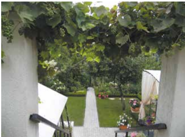
I miejsce w kategorii ogród przydomowy