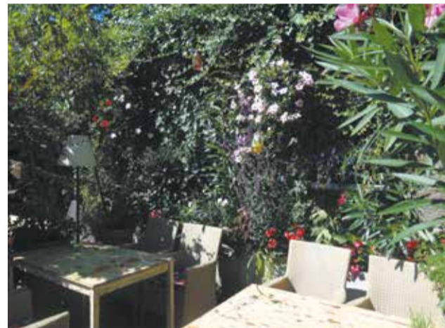
I miejsce w kategorii zieleńce